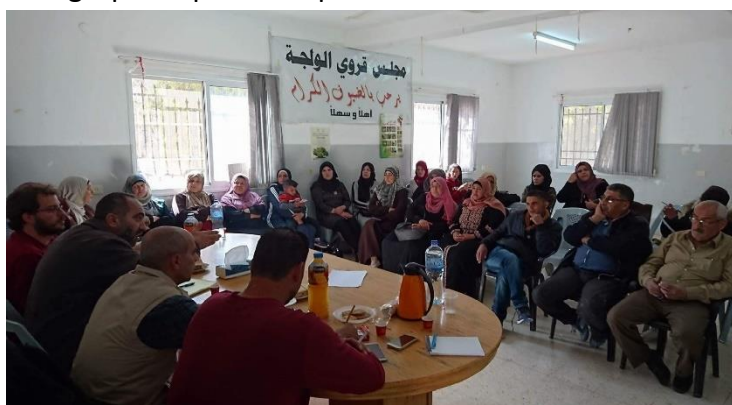
Reunión con los y las habitantes de Al-Walaja

Esta situación es la que actualmente sufre la población de Al-Walaja, en la Gobernación de Belén, la cual es destinataria del proyecto financiado por el Ayuntamiento de Córdoba, Delegación de Cooperación y Solidaridad, "Mejora de las capacidades de prevención y respuesta de la sociedad civil de la comunidad de Al-Walaja ante situaciones de violación de los Derechos Humanos y del Derecho Humanitario Internacional" , a través de su Convocatoria de subvenciones para proyectos de Acción Humanitaria del año 2016, y que está siendo implementado por Agricultural Development Association (PARC) y Asamblea de Cooperación por la Paz (ACPP), junto con la participación de la organización israelí Peace Now. Con este proyecto, actualmente en ejecución, se trata de mejorar las capacidades de prevención y respuesta de la sociedad civil de la localidad de Al-Walaja ante la situación de vulnerabilidad que sufre la comunidad. Se está trabajando en la formación de 25 mujeres y hombres en cuestiones de diseño y gestión de campañas de incidencia política, orientadas a la denuncia de incumplimientos del DIH y el DIDH y la documentación y difusión de estas violaciones de derechos, así como en la reducción del riesgo de desastres comunitarios. Con este grupo de personas pertenecientes a la comunidad se ha constituido y puesto en marcha